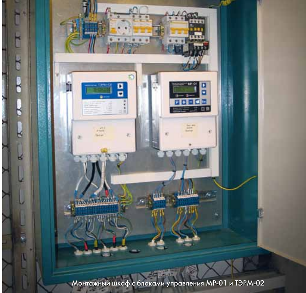
Монтажный шкаф с блоками управления МР-01 и ТЭРМ-02

Необходимость экономии энергоресурсов и наличие современного регулирующего оборудования стимулировали процесс автоматизации систем теплоснабжения.