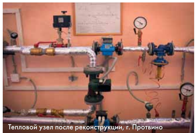
Тепловой узел после реконструкции, г. Протвино

В г. Протвино принята открытая схема централизованного теплоснабжения (рис. 1а) с зависимым присоединением потребителей, с элеваторным подмешиванием. Регулирование температуры теплоносителя осуществляется на источнике по температурному графику 150/70 со срезкой на 115 °С со всеми